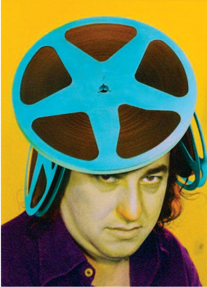
OUKA LELE (BÁRBARA ALLENDE), España. Albert Guspi , 1978. Gelatina de plata. 24 x 17 cm