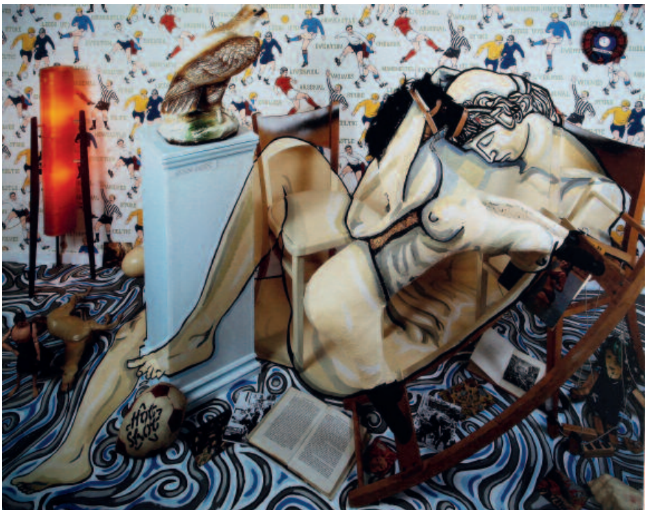
CALUM COLVIN, Reino Unido. Incubus , 1988. Cibachrome. 80 x 100 cm