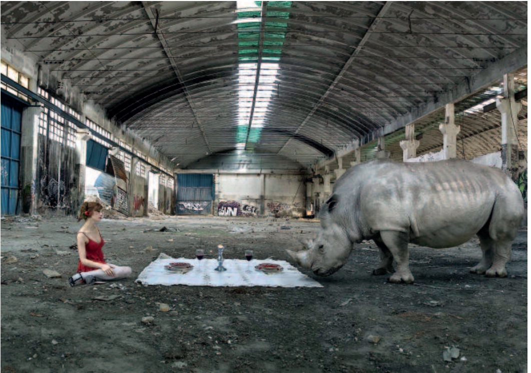
CECILIA DE VAL, España. First Anniversary , 2008. Impresión digital. 55 x 80 cm