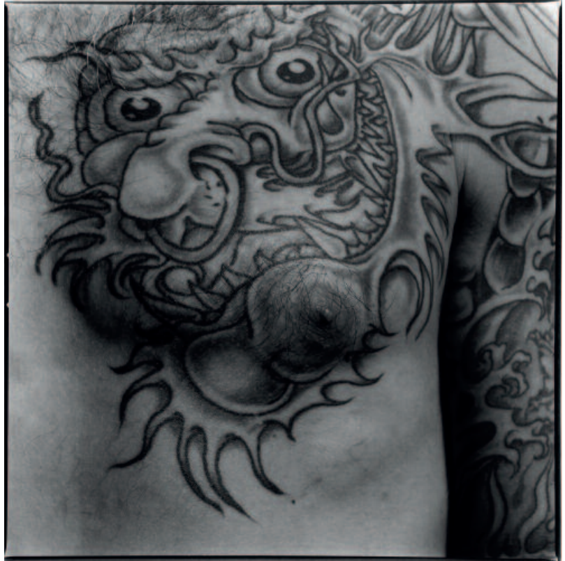
ALBERTO GARCÍA-ALIX, España. Autorretrato , 1995. Gelatina de plata virada. 42 x 42 cm