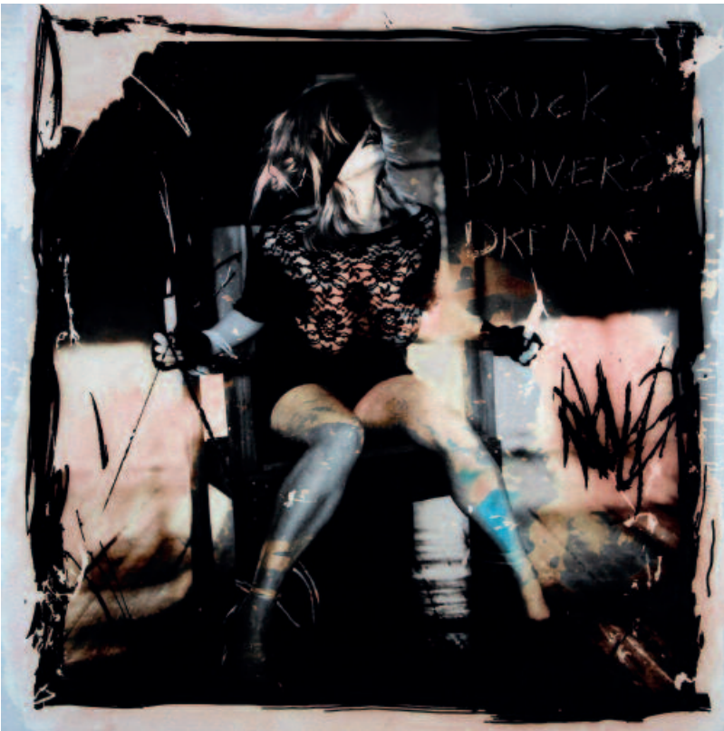
DAVID SELTZER, USA. Truck drivers dream , 1994. Gelatina de plata virada. 73 x 71 cm