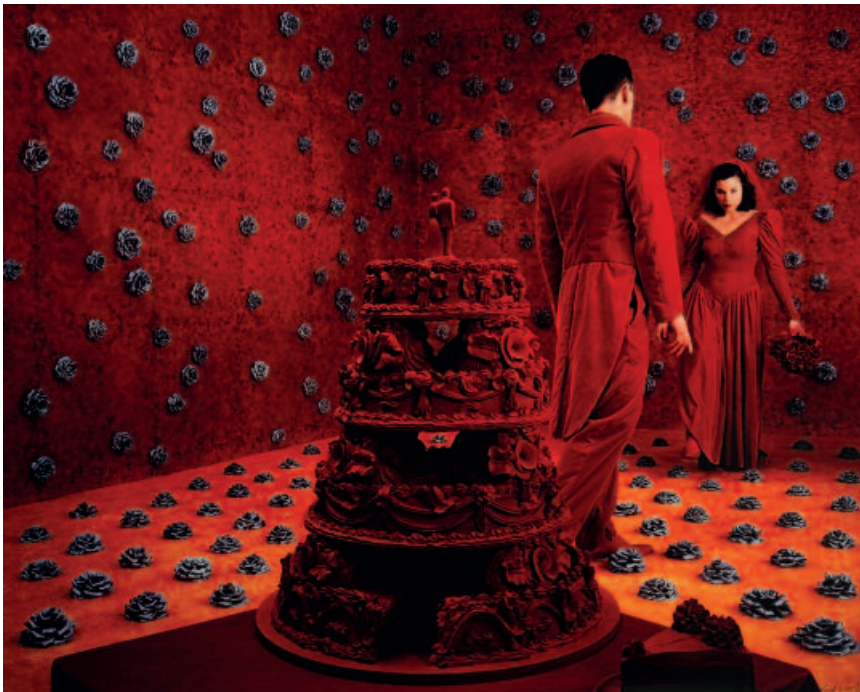
SANDY SKOGLUND, USA. La boda , 1994. Cibachrome. 80 x 110 cm